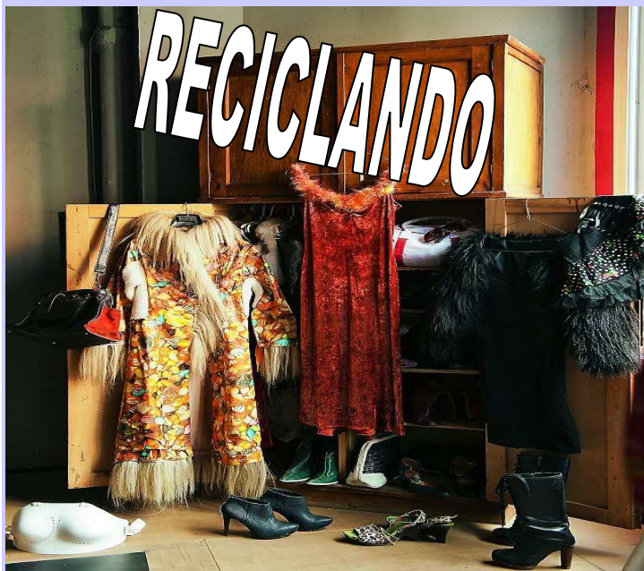
Abrigo de mantel de plástico reciclado (Sol Picó Cía. de Danza).